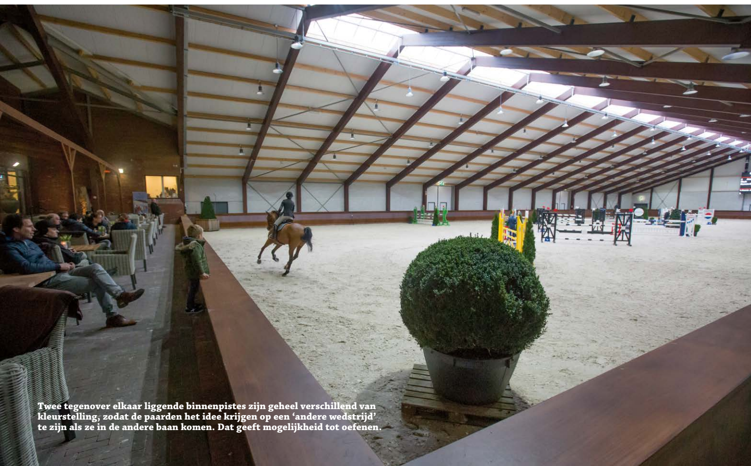
Twee tegenover elkaar liggende binnenpistes zijn geheel verschillend van kleurstelling, zodat de paarden het idee krijgen op een 'andere wedstrijd' te zijn als ze in de andere baan komen. Dat geeft mogelijkheid tot oefenen.

Voor 2016 staan er vijf internationale evenementen op het programma, dit zal in de toekomst nog verder uitgebreid worden. Op 15 maart staat de eerste gepland en daarna begint het buitenseizoen. Ook wordt in maart de eerste Subtop-dressuurwedstrijd verreden. Naast de beschikbare twee hoofdpistes en warm-up arena's buiten, kan er bij slechte weersomstandigheden gemakkelijk voor gekozen worden om binnen los te rijden. "De mogelijkheden zijn eindeloos, je zou hier zelfs wedstrijden in twee disciplines naast elkaar kunnen organiseren. Ook bijzonder is dat het hele gebouw en de buitenpistes 100 procent gespiegeld zijn. Dat geeft veel mogelijkheden om dingen te combineren", vertelt Frank Laenen, die door zijn baan de interesse in de paardensport voelt groeien. "Daarnaast hebben we hier diverse vergaderzalen en hebben we als doel om 52 weken in het jaar geopend te zijn. De prioriteit ligt bij de paardensport en we kunnen eventuele gaten in de kalender opvullen met andere activiteiten en evenementen. We zijn enorm plezierig van start gegaan en dit hopen we zo vol te houden en uit te breiden. Voor mij en mijn team is het een prachtige uitdaging de exploitatie te leiden."